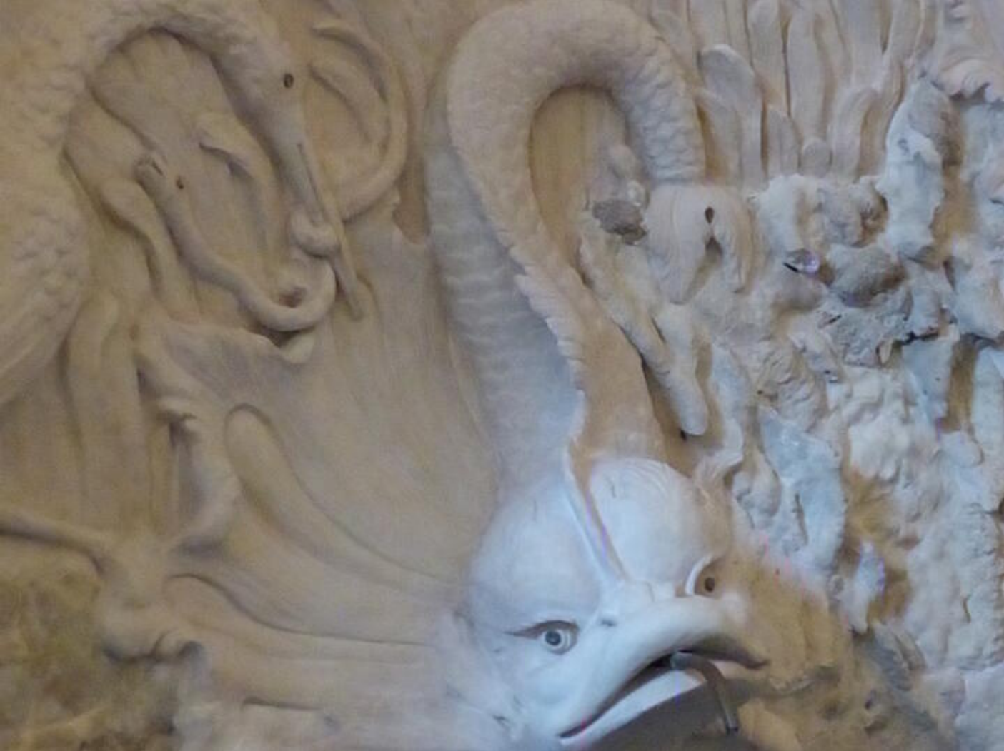
Visite guidée Saint-Antoine au fil du temps - Le temps des bâtisseurs : splendeurs du gothique 38160 Saint-Antoine-l'Abbaye

Visite permettant de découvrir des espaces qui ne sont pas ouverts au public.